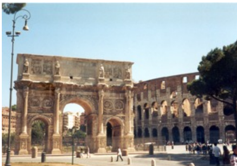
Arco de Constantino y Coliseo. Roma. Foto del autor, 2002