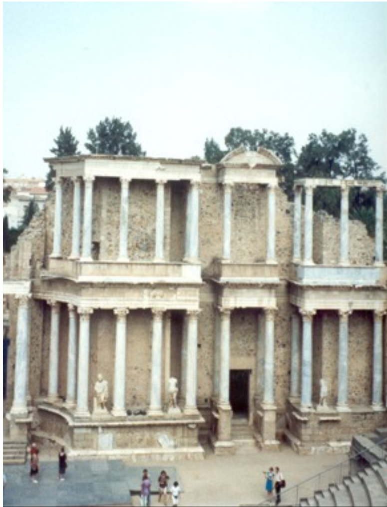
Escena del Teatro romano de Mérida. Foto del autor, 1991