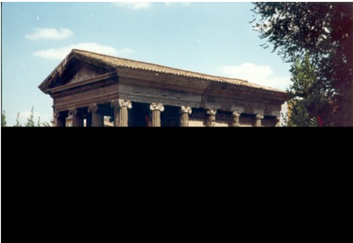
Templo de Portuno en el Foro Boario de Roma. Foto del autor, 2002